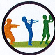
LA VIE ASSOCIATIVE