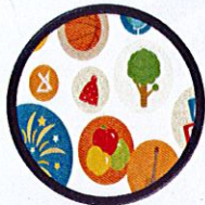
LES ACTIVITÉS PÉRISCOLAIRES