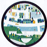
LES AMÉNAGEMENTS (routes, bâtiments,...)